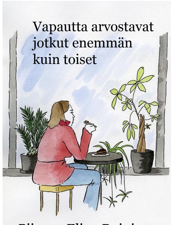
Piirros: Elina Roininen

Velkasuossa (asunto-, auto-, ja muut kulutuslainat) elävää on helppo hallita